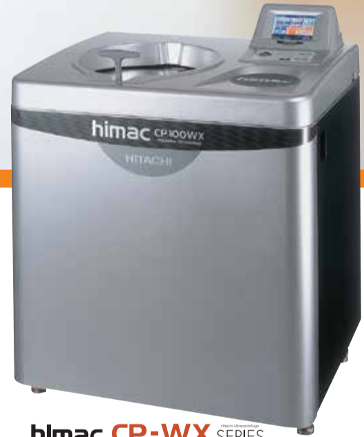
himac CP-WX SERIES CP100WX/CP90WX/CP80WX

Ultrasantrifüjlerde Patentli RLM (Rotor Life Management) Teknolojisi ile 10 kat daha uzun rotor ömrü