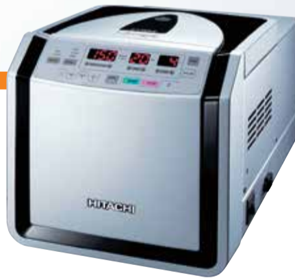
himac CT SERIES CT15RE/CT15E