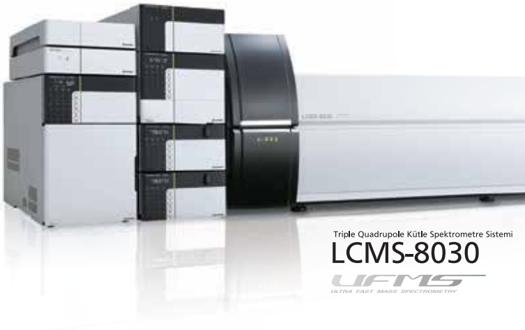
Triple Quadrupole Kütle Spektrometre Sistemi LCMS-8030 UFMS ULTRA FAST MASS SPECTROMETRY