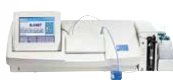
Otomatik Polarimetreler / Sakkarimetreler