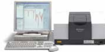
Shimadzu IRAffinity-1 Fourier Transform Infrared Spektrofotometre