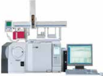
Shimadzu GCMS-QP2010 Ultra/SE Gaz Kromatografi Kütle Spektrometre Sistemi