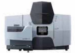
Shimadzu AA-7000 Atomik Absorpsiyon Spektrofotometre