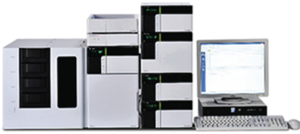
Shimadzu Prominence LC-20A Yüksek Performanslı Sıvı Kromatografi HPLC Sistemi