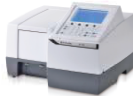
Shimadzu UV-1280 UV-VIS Spektrofotometre