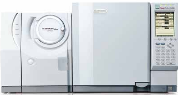
GCMS-QP2010 Ultra Gaz Kromatografi/Kütle Spektrometre

Referanslarımız için mutlaka iletişime geçin.